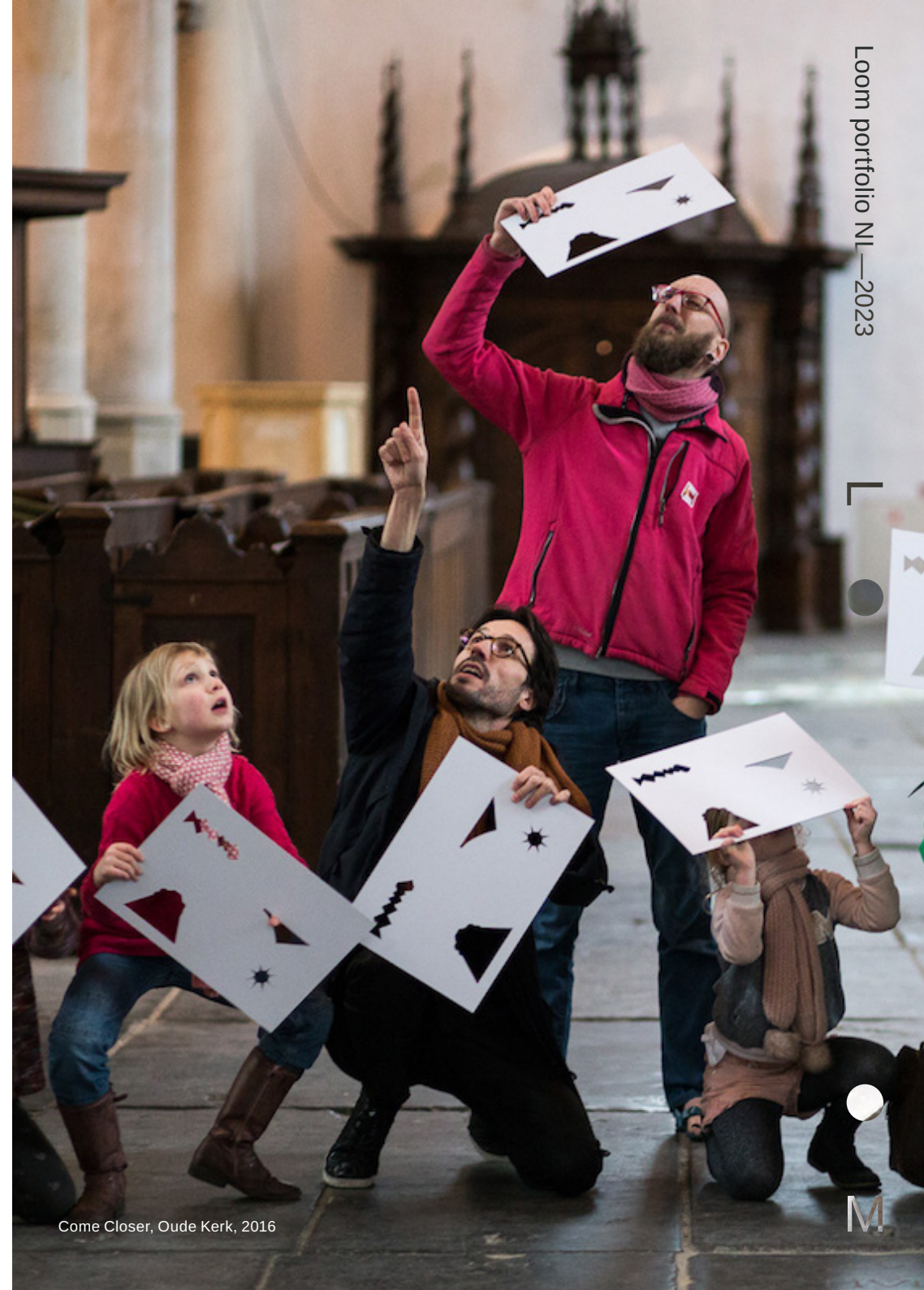
Come Closer, Oude Kerk, 2016

René Boer werkt als criticus, curator en organisator op het gebied van architectuur, kunst, design en erfgoed. Hij beweegt zich tussen Amsterdam en Caïro en is een drijvende kracht achter het platform Failed Architecture. De afgelopen jaren ontwikkelde hij een breed scala aan tentoonstellingen, publieke programma's en onderzoeksprojecten, vaak met een focus op ruimtelijke rechtvaardigheid, stedelijke verbeelding en queer tactieken. Zijn huidige projecten omvatten Contemporary Commoning, een experimenteel onderzoek naar de relatie tussen kunst en (stedelijke) commons; Terraforming Indonesia, een programma waarin grootschalige landaanwinning wordt onderzocht en opnieuw verbeeld in samenwerking met het collectief ruangrupa; en Smooth City, een binnenkort te verschijnen publicatie over de wereldwijde obsessie met perfectie in steden.