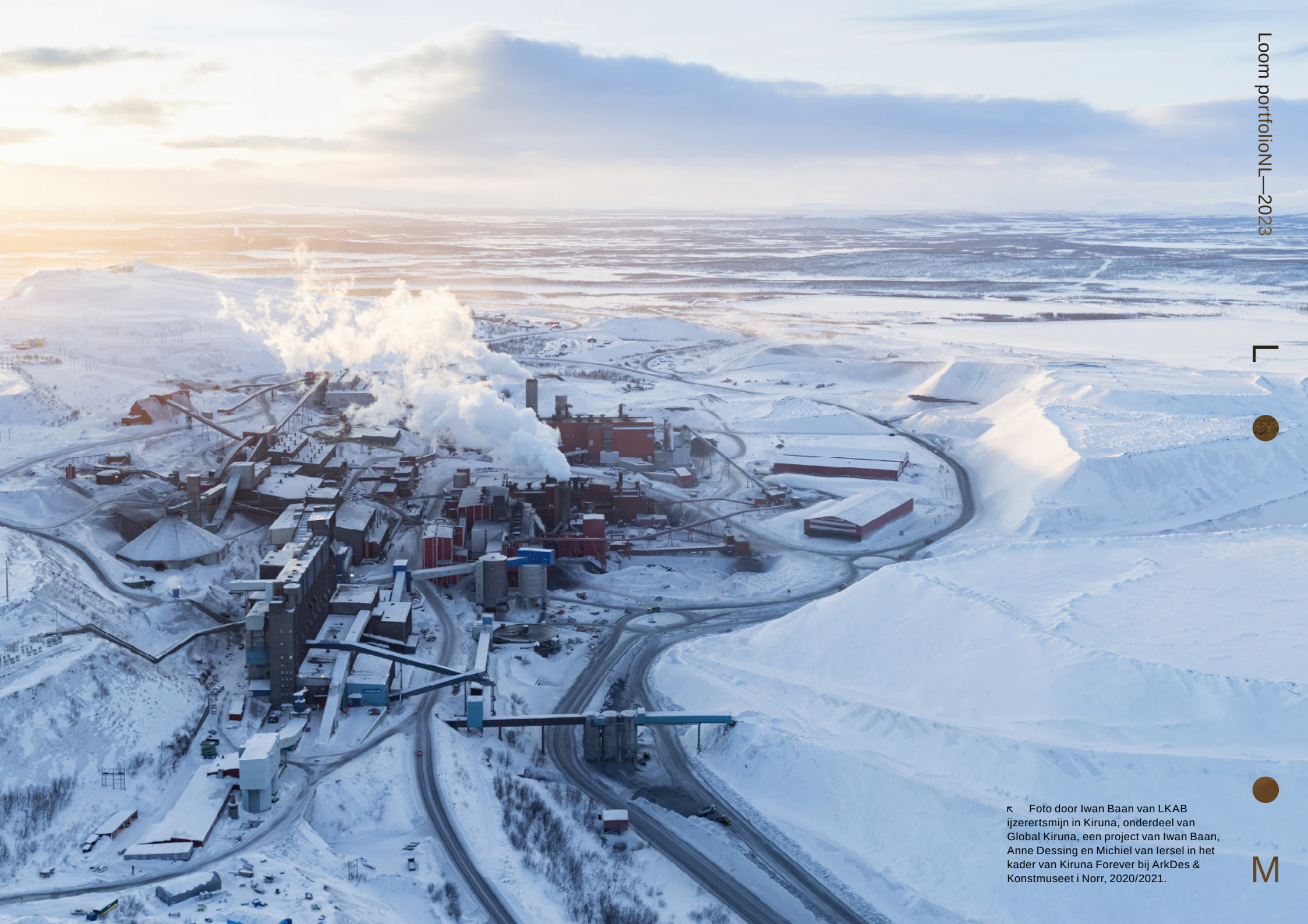
κ Foto door Iwan Baan van LKAB ijzerertsmin in Kiruna, onderdeel van Global Kiruna, een project van Iwan Baan, Anne Dassing en Michiel van Iersel in het kader van Kiruna Forever bij ArkDes & Konstmuseet i Norr, 2020/2021.