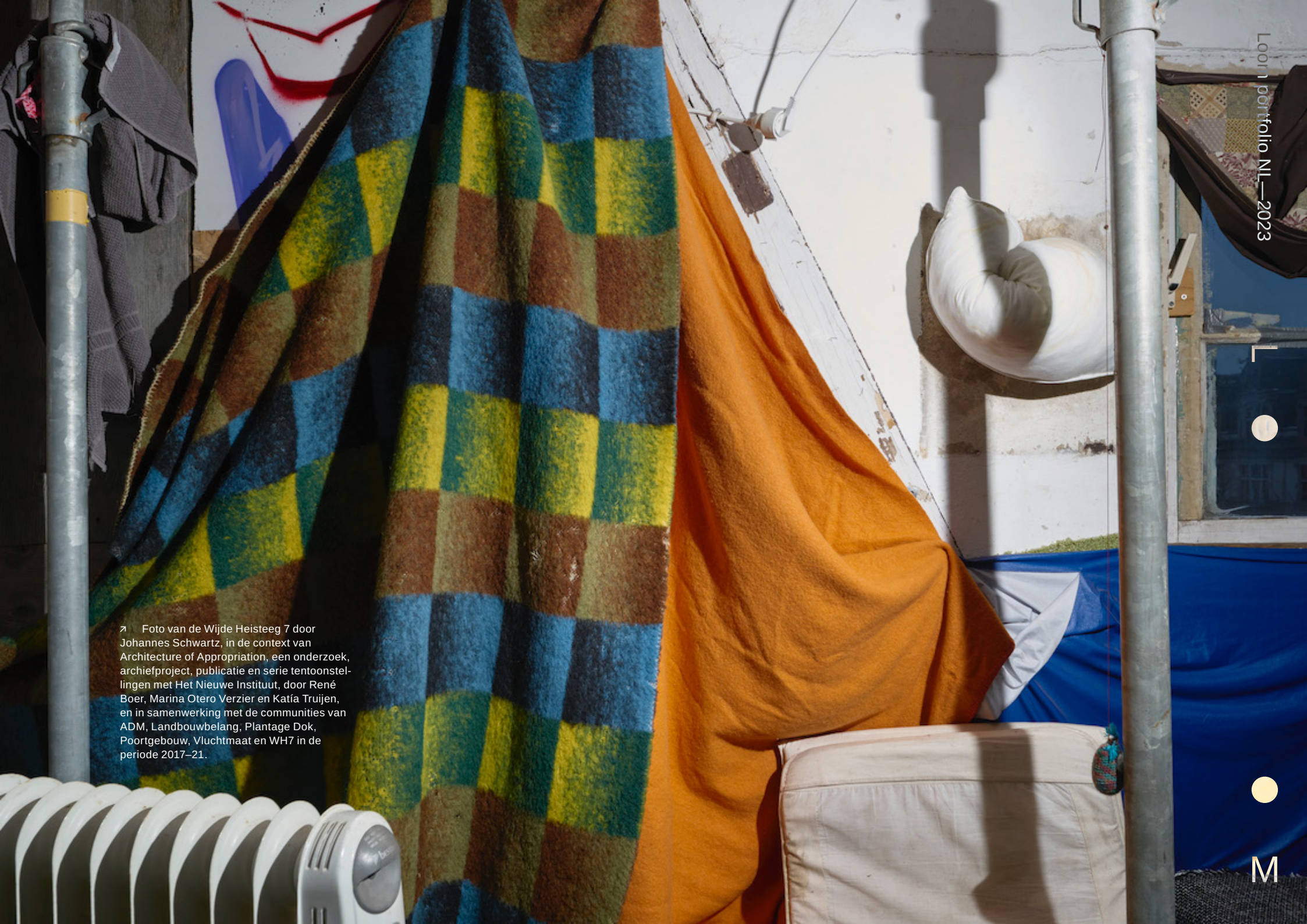
➤ Foto van de Wijde Heisteeg 7 door Johannes Schwartz, in de context van Architecture of Appropriation, een onderzoek, archiefproject, publicatie en serie tentoonstellingen met Het Nieuwe Instituut, door René Boer, Marina Otero Verzier en Katja Truijten, en in samenwerking met de gemeenschappen van ADM, Landbouwbelang, Plantage Dok, Poortgebouw, Vluchtmaat en WH7 in de periode 2017–21.